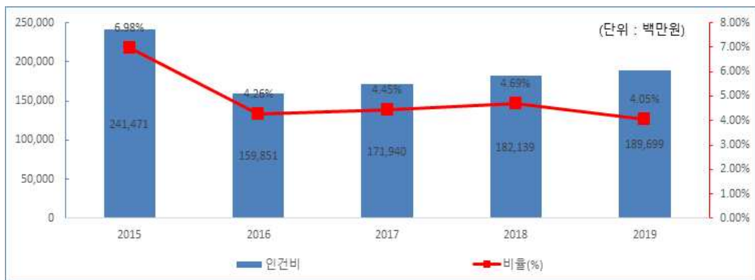
인건비 연도별 변화

☞ 전년대비 공무원 보수 인상 및 신규전입자 등 증가에 따른 집행대상 인원 증가 등의 사유로 공무원 인건비 집행액이 다소 증가하였으나 전년대비 세출결산액 확대로 인건비 비율은 낮아졌습니다.