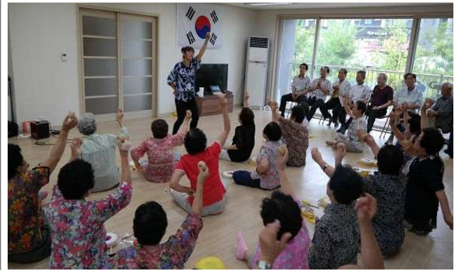
청원구 울량동 LH9단지아파트 경로당