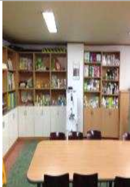
전시 및 상담실