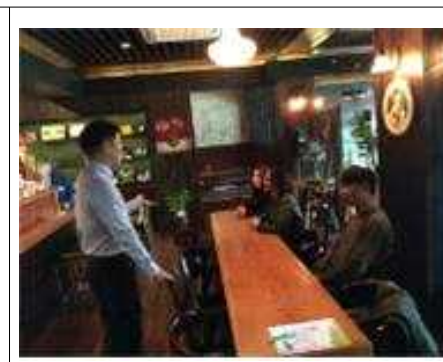
진로멘토의 멘토교실 (바리스타 진로멘토)