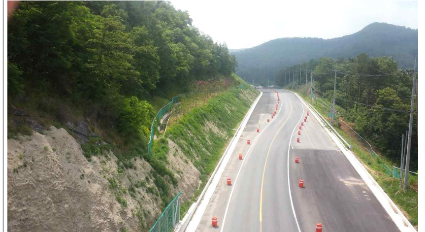
STA 1+600 ~ 2+680 4차선 공사 완료 (표층제외)