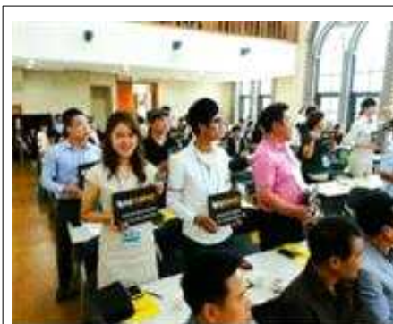
및 멘토단 발대식(7.22)