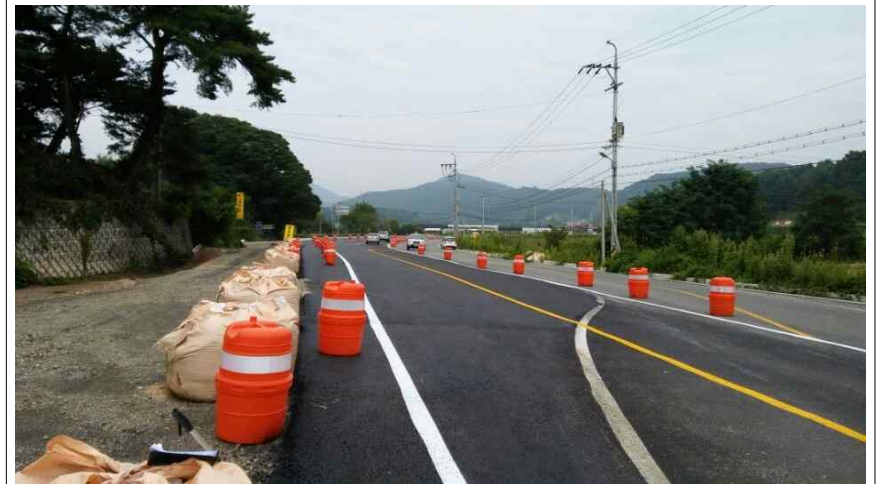
STA 0+300 ~ 1+200 2차선 공사 완료