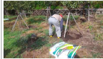
청주시:유실수 재배를 통한 마을 수익 창출