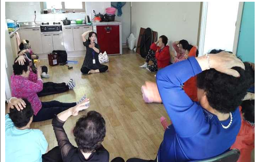
진천읍 읍내리구 경로당