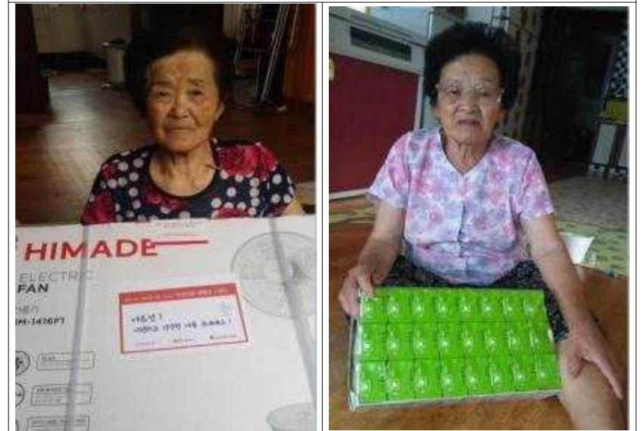
독거노인 후원물품 전달