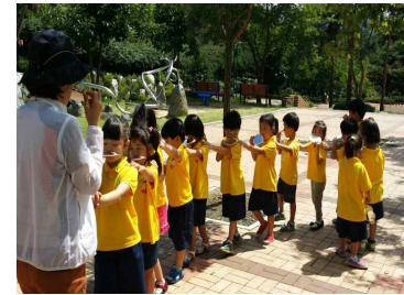
영동군:자연생태도시와 함께하는 영동스타텔링