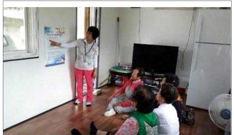
독거노인 대상 폭염대비 행동요령 교육