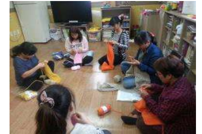
증평군:나눔 한올 행복엮기